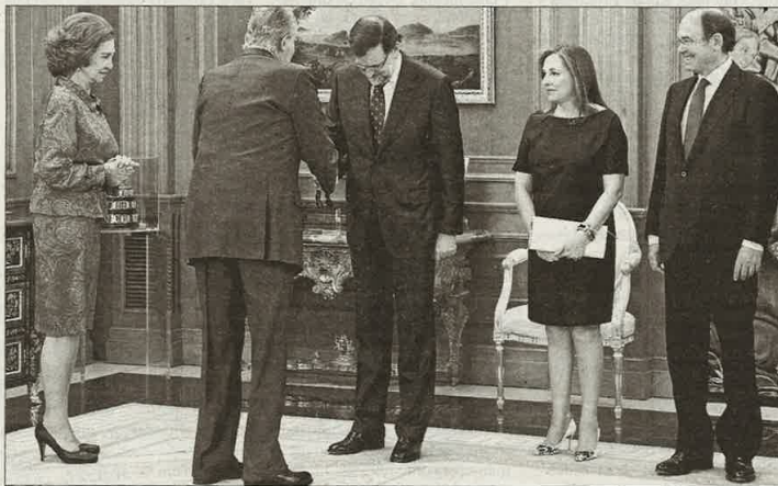
La Reina Sofía clava su vista en los zapatos de Viri, mientras los esposos se estrechan la mano.

Por cierto, yo no sé tú pero, lo que es yo, encuentro bien monos los zapatos de Viri, pero con Sofia nunca se sabe. Llevamos 39 años sin saber y que nos quedemos sin enterarnos. Esa es una de las características de esta reina griega con la expresividad facial de un gato, que no sabes si aprueba o desaprueba pero parece que siempre juzga. Viri qui-