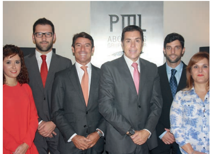
Equipo de PML Abogados, en Valencia.

Ofrecen la calidad, eficiencia y garantía de un gran despacho, combinada con un gran valor añadido: el trato más directo y personal a sus clientes.